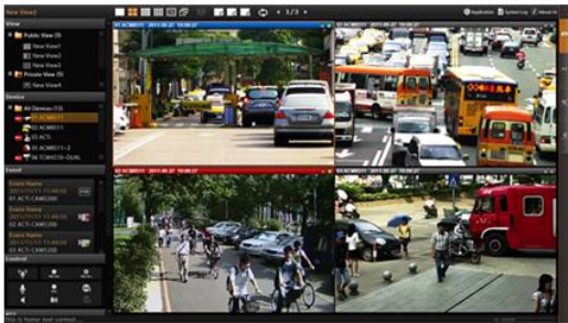
Software editions of NVR 3 ACTi 網路影像錄影軟體