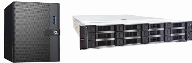
Standalone NVR options based on NVR 3.