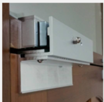
陽極鎖 / 磁力鎖